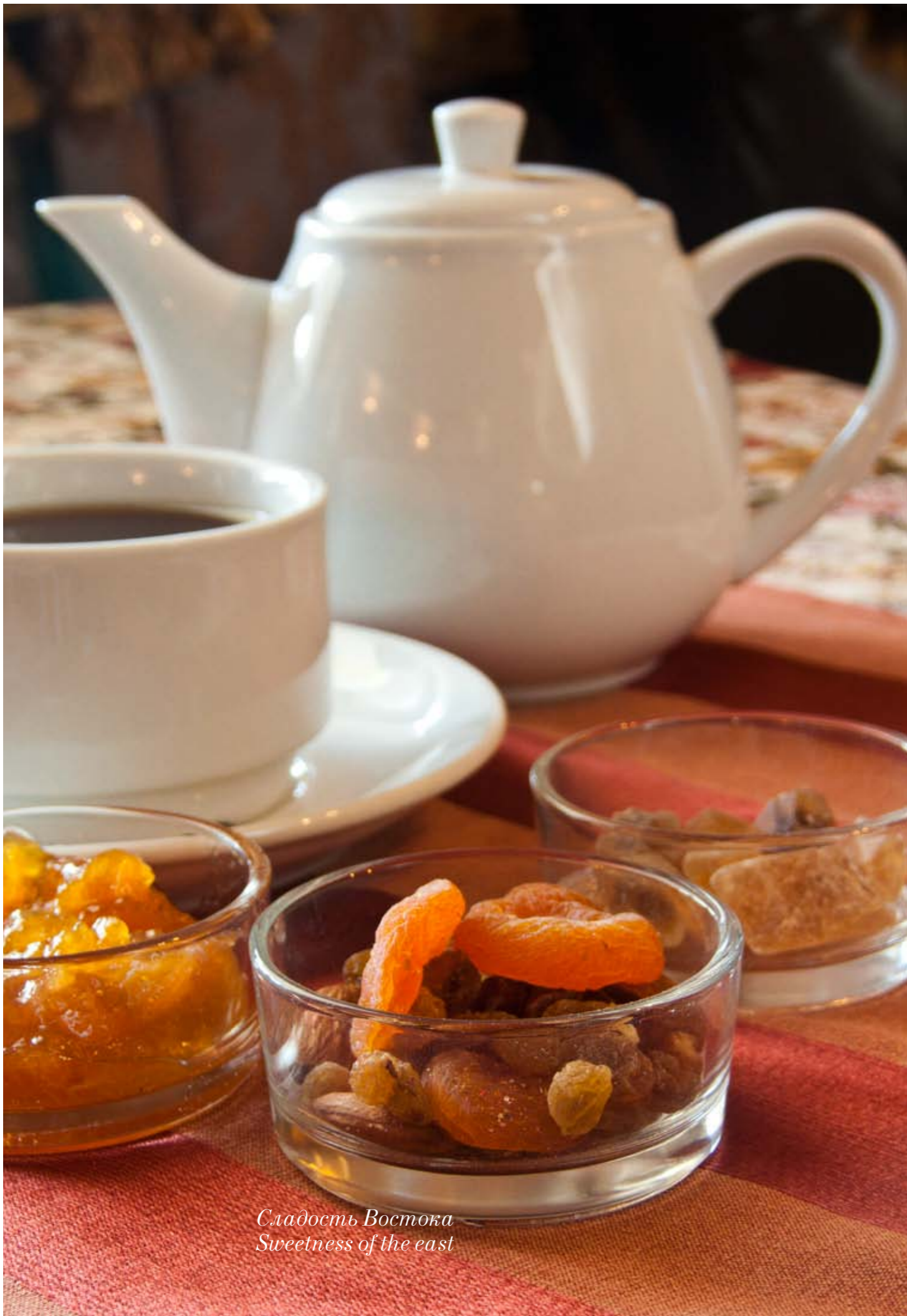
Сладость Востока Sweetness of the east