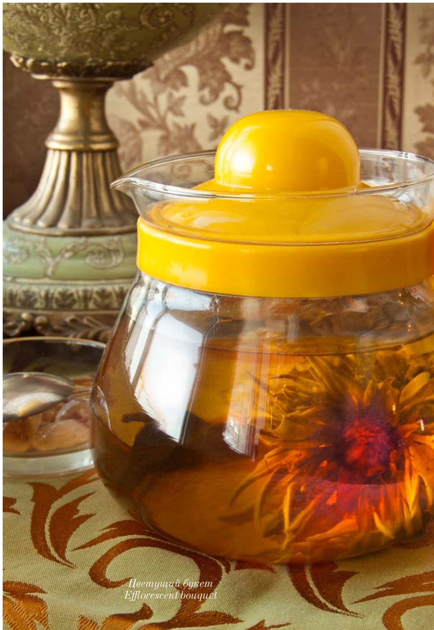
Цветущий букет Efflorescent bouquet