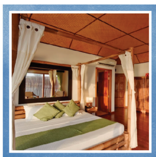
SEMI-WATER BUNGALOW (15 комнат)

Пляжные бунгалос с роскошной ванной, современной мебелью, панорамными зеркалами, двойными умывальниками. Комната открывается с помощью стеклянной двери на террасу с лежаками.