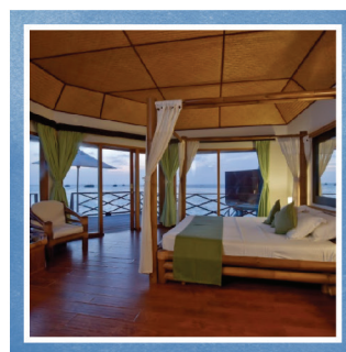
WATER BUNGALOW (39 комнат)

Насладитесь прямым выходом в лагуну и в то же время, прямым выходом на пляж! Дневной свет в комнатах и восхитительный вид на лагуну.