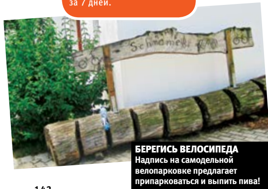
БЕРЕГИСЬ ВЕЛОСИПЕДА Надпись на самодельной велопарковке предлагает припарковаться и выпить пива!

Благодарим Therme Laa – Hotel & Spa u la pura Women's Health Resort Kamptal за помощь в подготовке материала.