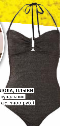
ПЛЫВИ, ЛОЛА, ПЛЫВИ Слитный купальник (Accessorize, 1900 руб.)