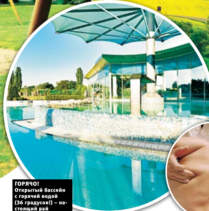
ГОРЯЧО! Открытый бассейн с горячей водой (36 градусов!) – на- стоящий рай