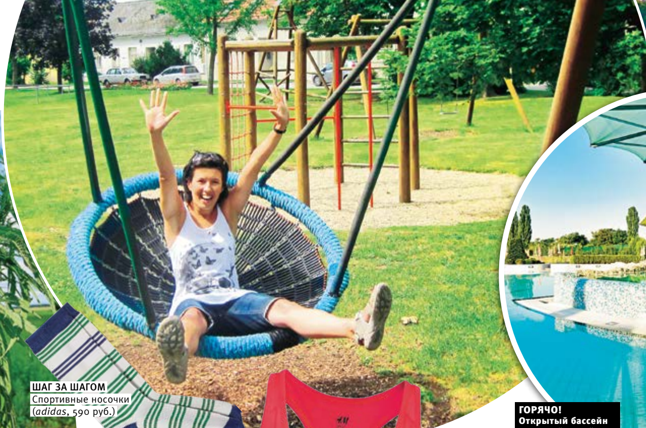
ШАГ ЗА ШАГОМ Спортивные носочки (adidas, 590 руб.)