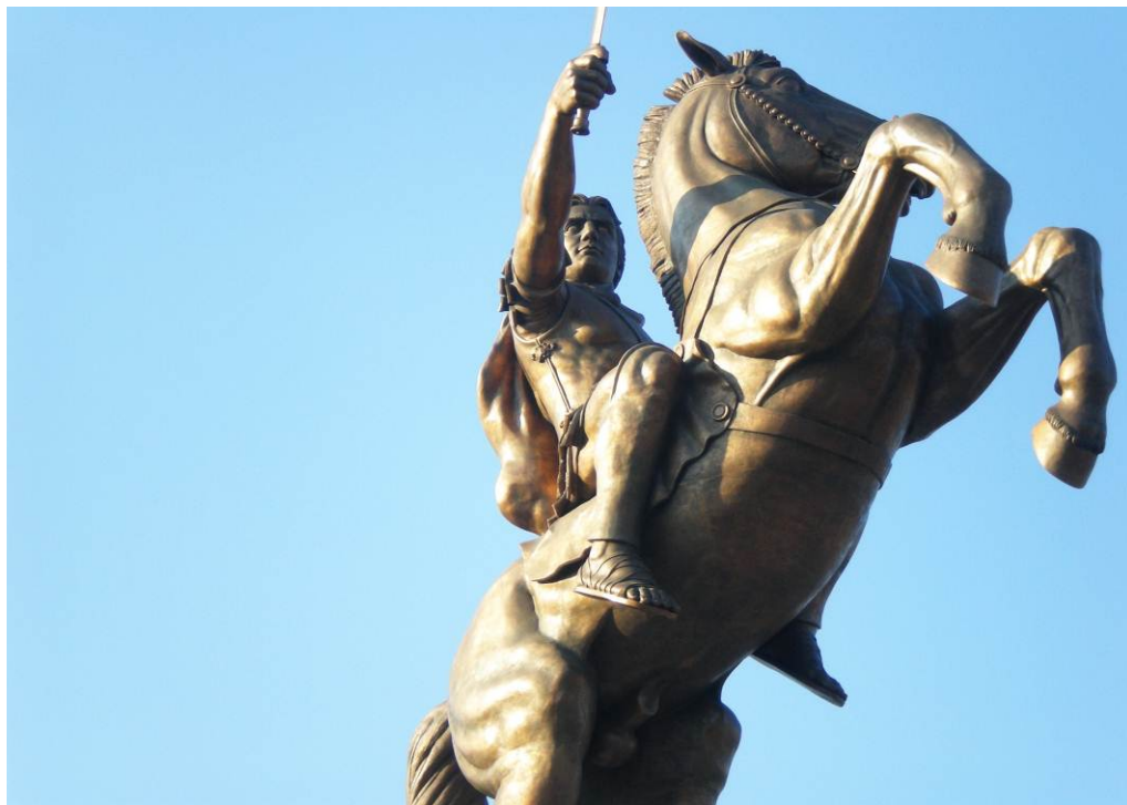
ПЕЛЛА И ВЕРГИНА