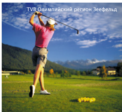
TVB Олимпийский регион Зеефельд