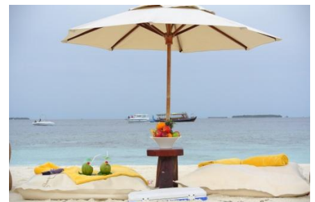
Пикник на песчаной отмели