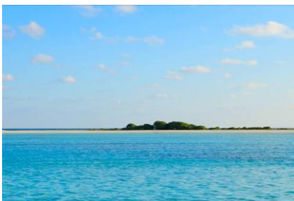
Опыт Робинзона Крузо

Пожалуйста, обратитесь к страницам 16-18 для более подробной информации по каждой экскурсии.