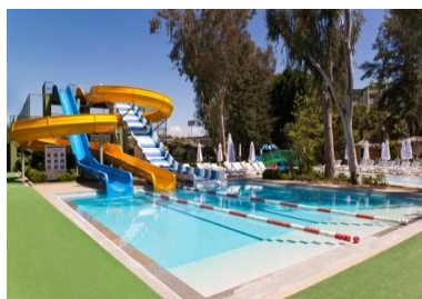
Бассейн с горками 2