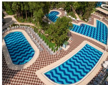
Бассейн 3, 4, 5