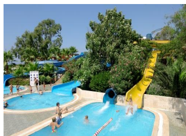
Бассейн с горками 1