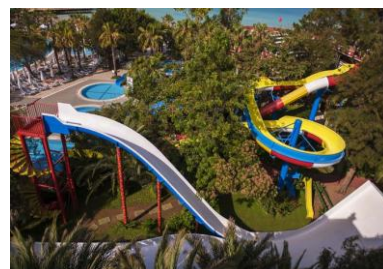
Бассейн с горками 3